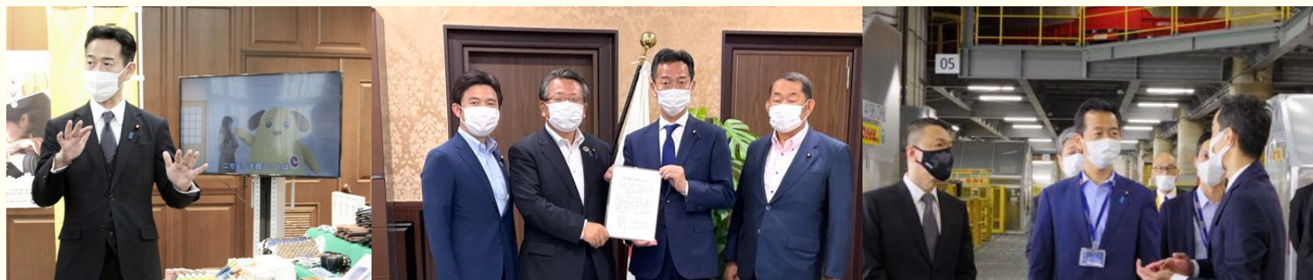
税関による知的財産侵害物品展示の視察

我が国の基盤を支える、財務省・税関・財務局・国税庁の総勢7万人からなるチームの一員として、ともに日本を前に進めてまいりました。これからは一議員として、必要な政策には十分な財政出動するとともに、「無駄なお金は1円も使わない」という、当たり前前の価値観をしっかりと持ち、引き続き働いてまいります。