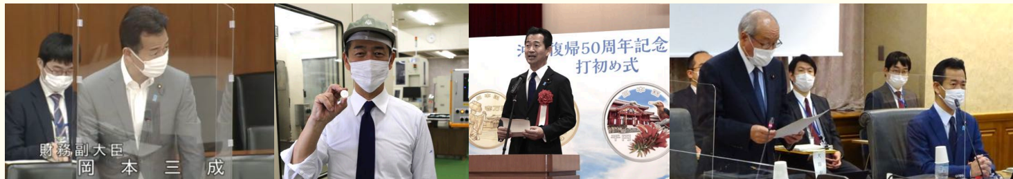
財務副大臣 岡本三成