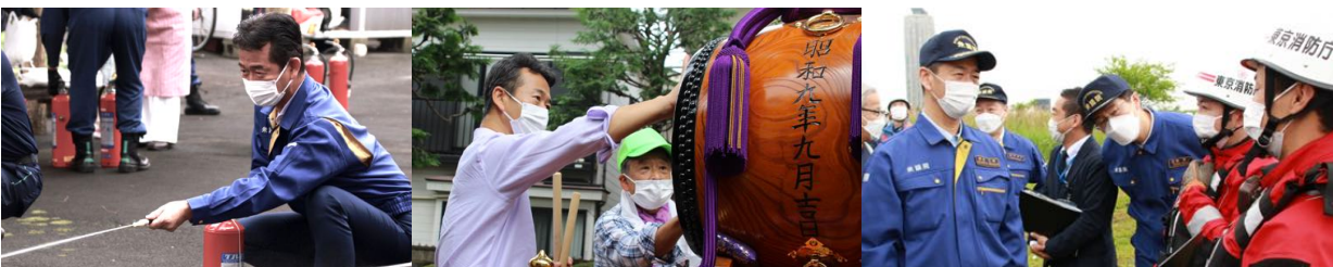
浮間自治会防災訓練(8/21)