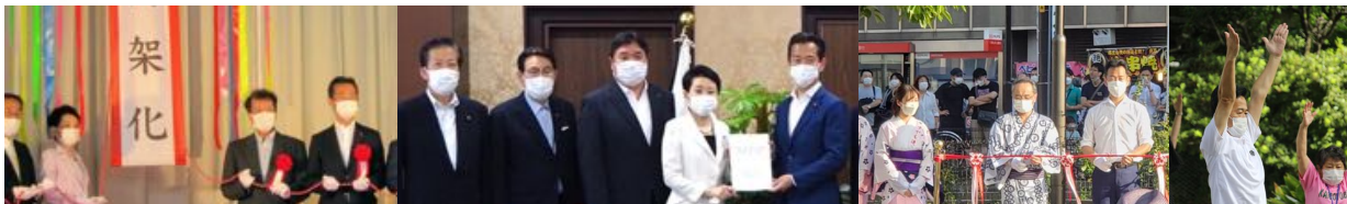
竹ノ塚駅付近連続立体交差事業 高架化記念式典(6/12)