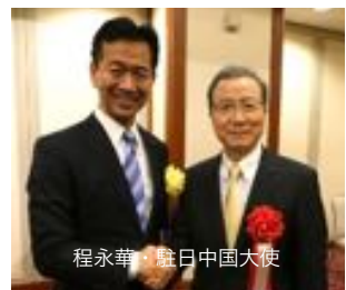
程永華・駐日中国大使

今年は、日中平和友好条約締結40周年の節目。更に日中関係を深化させていく決意を述べました。