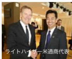
ライトタワー米通商代表

ブエノスアイレスで開催された、第11回世界貿易機関（WTO）閣僚会議に出席。各国の閣僚と懇談を行いました。