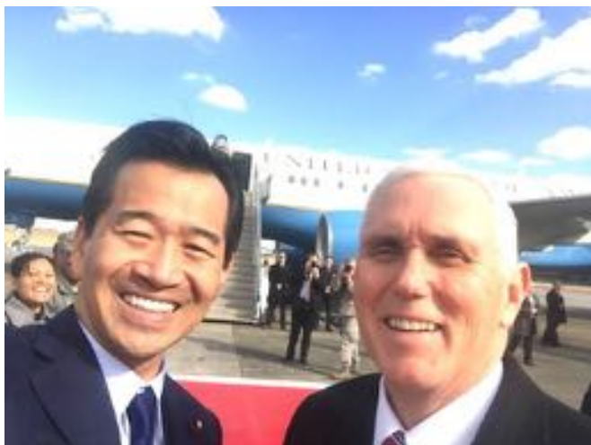
横田基地で、離日するペンス米副大統領を見送り（2/8）