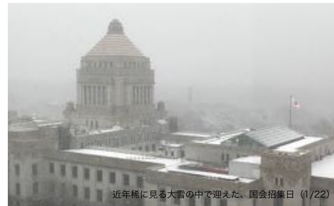
近年稀に見る大雪の中で迎えた、国会招集日（1/22）

また平成30年度予算案には公明党の強い要請により、待機児童解消のための受け皿拡大や幼児教育無償化、介護人材の処遇改善の予算が盛り込まれています。また返済不要の給付型奨学金の2018年度からの本格実施のための予算も計上されています。来年度予算の年度内の早期成立を目指してまいります。