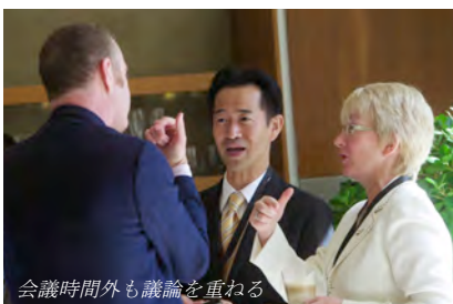
会議時間外も議論を重ねる