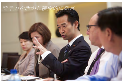
語学力を活かし積極的に発言