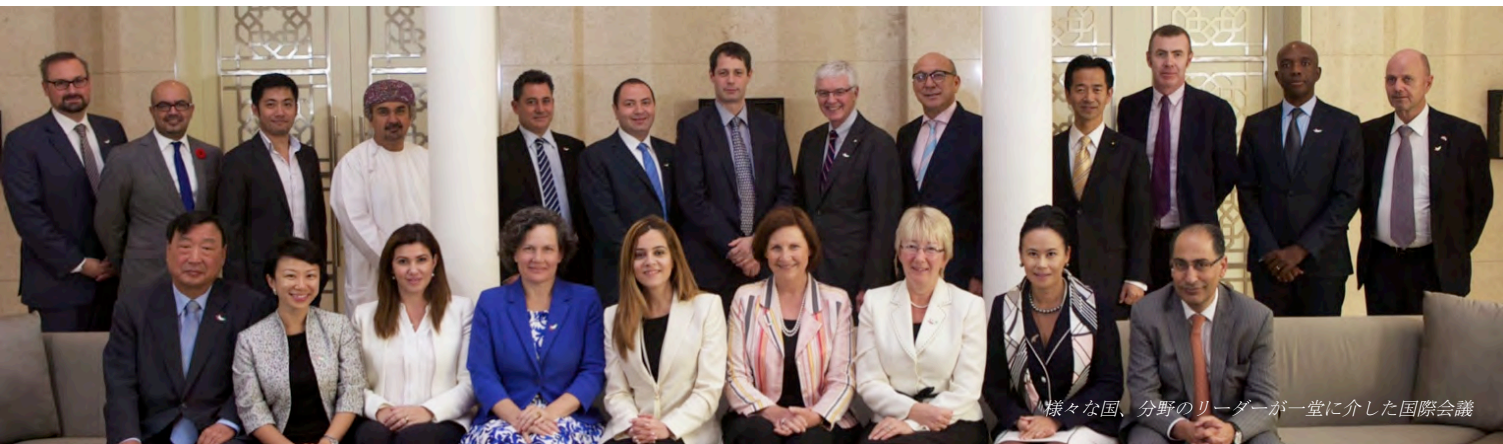
様々な国、分野のリーダーが一堂に介した国際会議

以前、信頼する米国下院議員に、「外交に携わる国会議員の仕事は、他国のリーダーと友達になることだよ。なぜなら、友達から頼まれたことは、断れないだろ！」と言われたことを思い出します。世界中に平和のネットワークを築き、どんな事も話し合いで解決出来る責任を担ってきたいと決意しています。