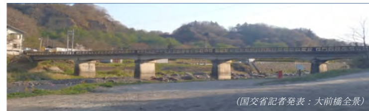
(国交省記者発表：大前橋全景)

群馬県嬭恋村の老朽化した大前橋の安全検査を国で実施してほしいとの村長の要請を受け、直ちに太田国交大臣に陳情しました（8月）。そして9月末に、日本初となる、国によるインフラ老朽化検査実施を実現させました。